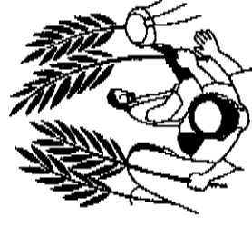
Dimanche des Rameaux et de la Passion.