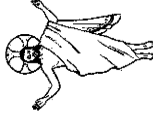
Pâques : Résurrection du Seigneur.