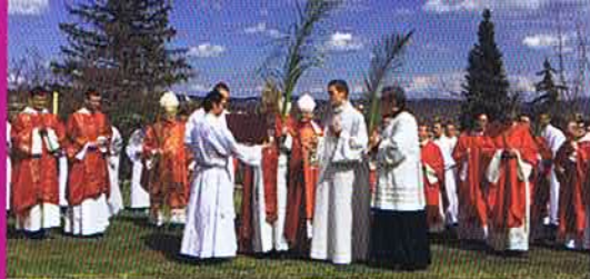
PÉLERINAGE DU PUÿ